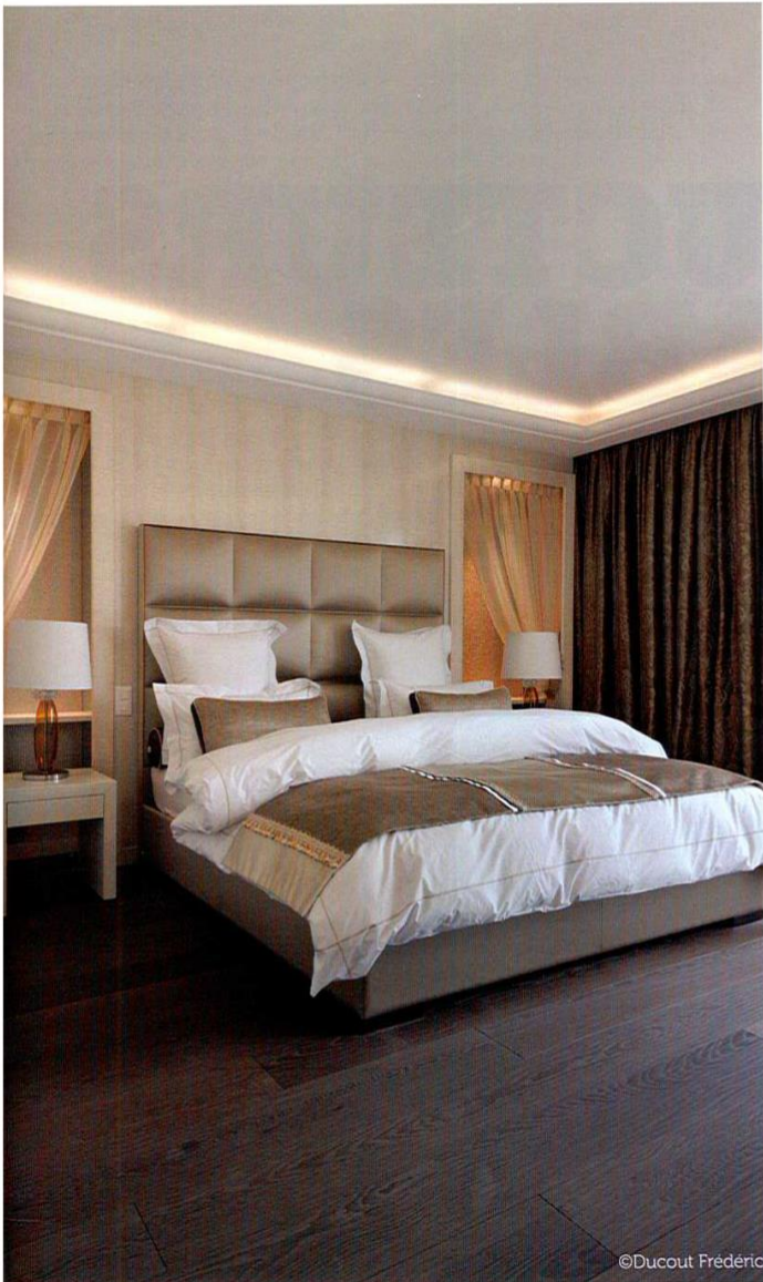
Boiserie en Erable ondé et parquet Wenge