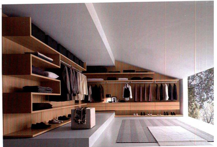
Dressing signé Pressotto